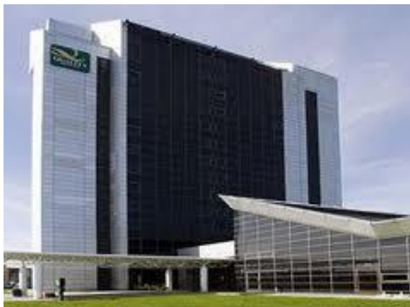
Quality Hotel Panorama