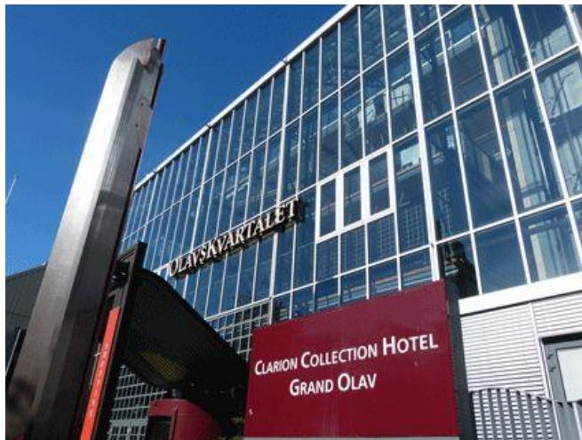
Clarion Collection, Grand Olav