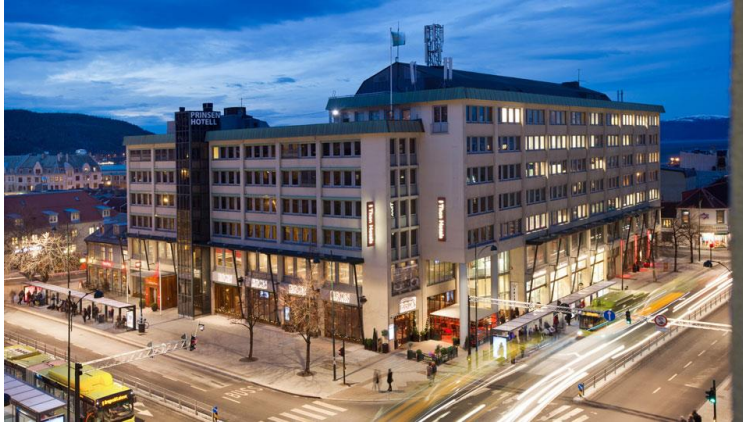
Thon Hotel Prinsen