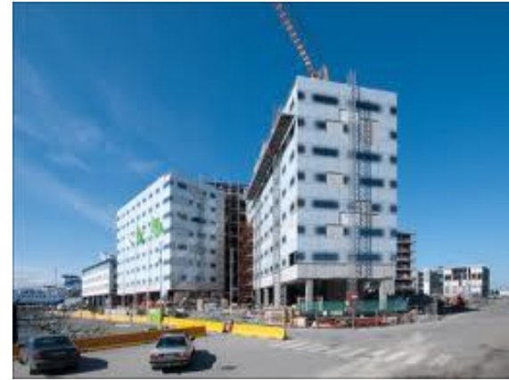
Clarion Hotel & Congress