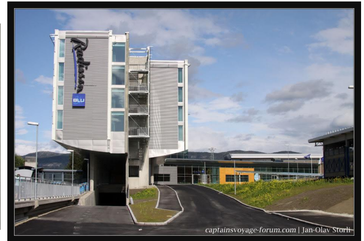
Radisson blu, Værnes