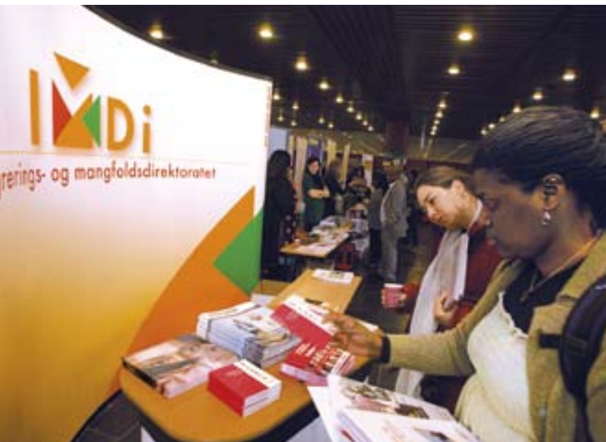
IMDi og KIM på stand for å informere om korleis ein kan røyste ved valet.