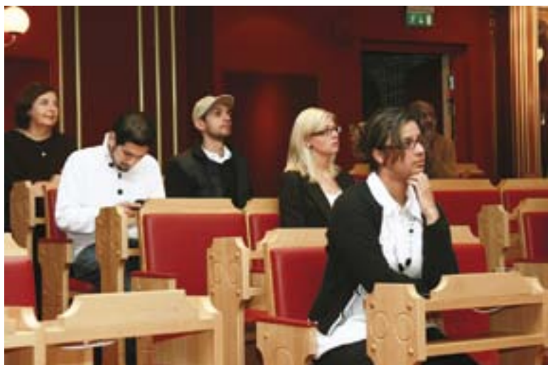
MiniTinget er eit rollespel for elevar ved vidaregåande skular som vitjar Stortinget. Sjå www.tinget.no .