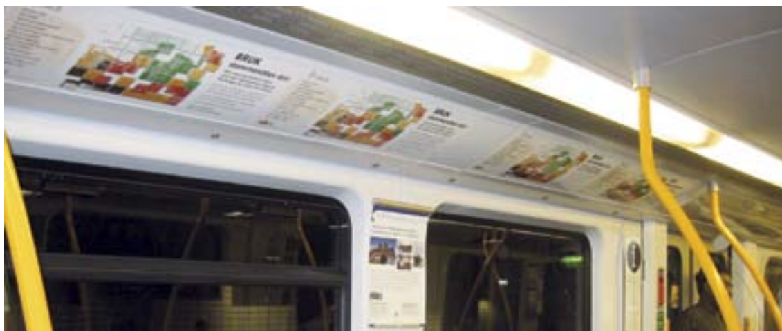
Annonsering på T-banen i Oslo som oppmoda folk om å røyste.