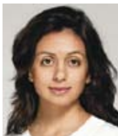
Hadia Tajik