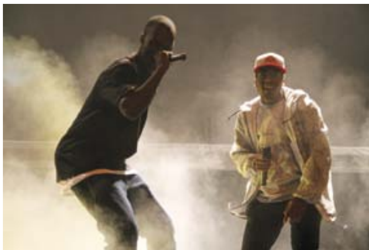
RAPVALG 2009 mobiliserte unge veljarar til å delta i valet. Sjå www.rapvalg.no .

Bruk av sentrale omgrep. Det vil gjennom rapporten bli presentert statistikk over valdeltakinga blant innvandrarar og norskfødde med innvandrarforeldre. Denne statis-