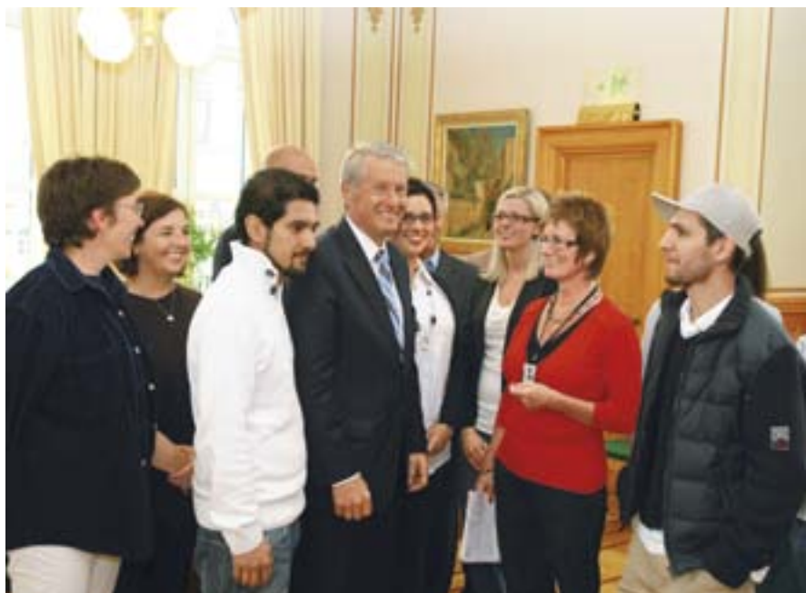
Stortingspresident Thorbjørn Jagland tek imot KIM, IMDi og representantar frå ungdomsorganisasjonar i juni 2009.

Han finn vidare at grad av sosial kapital har stor innverknad på om ein deltek ved val eller ikkje. Til lågare sosial kapital, til mindre er sannsynet for både konvensjonell politisk deltaking, altså det å røyste ved val, og ukonvensjonell politisk deltaking, til dømes underskriftskampanjar, avisinnlegg og det å kontakte ein politiskar direkte. Han understrekar at også andre og meir etablerte individuelle faktorar har innverknad på den politiske