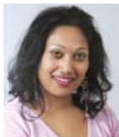
Saera Khan (AP)