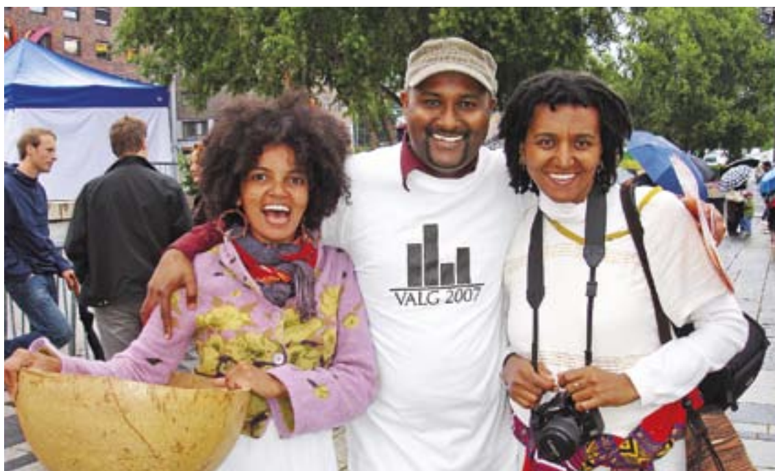
IMDi og KIM hadde stand på Mela-festivalen før lokalvalet i 2007.

Kan det vere at slik som kvinnene opplevde hindringar for å nytte seg av moglegheita til politisk deltaking i førre hundreåret, slik kan andre grupper av befolkninga oppleve barrierar for politisk deltaking i samfunnet i dag? Vi bør i alle fall ta inn over oss lærdomen om at det er forskjell på formell og reell tilgang til politisk innverknad.