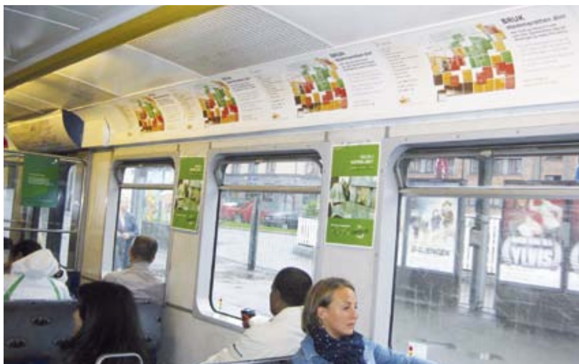
Annonsering på T-banen i Oslo som oppmoda folk om å røyste.